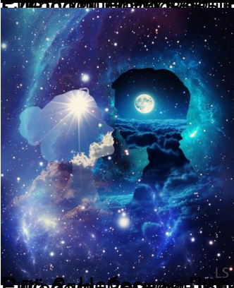
Позвуй Любови сз Аримдойщий Землэй: