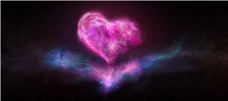
дримусь званя Небоамисом, рис. 2.